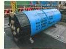
推進マシ（岩盤対応タイプ）