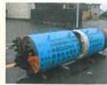
推進マシ（普通タイプ）